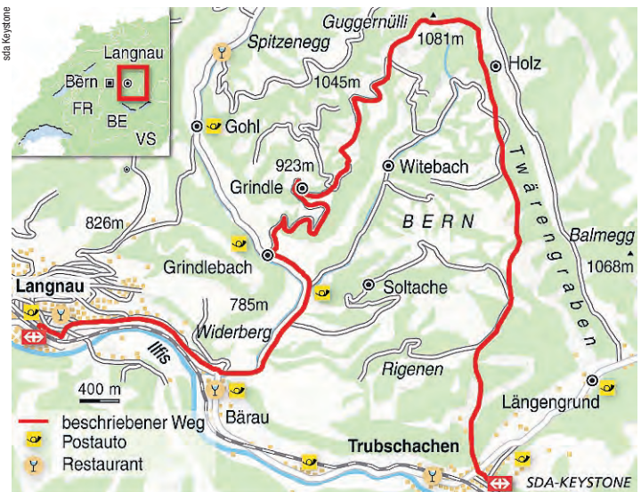
Eine lohnende Schlaufe: über Guggernülli von Langnau nach Trubschachen.

Entlang des Twärengrabens geht es auf einem lang gezogenen Höhenrücken weiter Richtung Süden. Danach folgt ein kurzer und recht steiler Abstieg nach Trub-