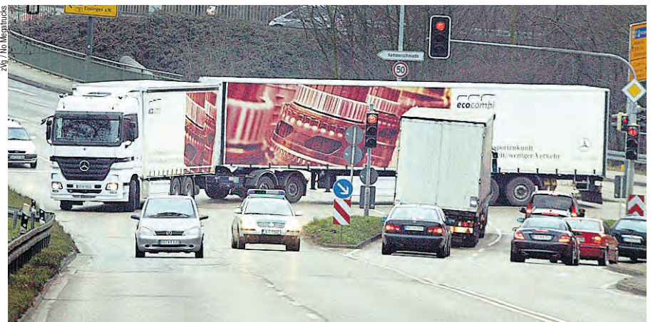
«Wehret den Anfängen!», heisst es im Aufruf der Bahngewerkschaften gegen die Megatrucks.