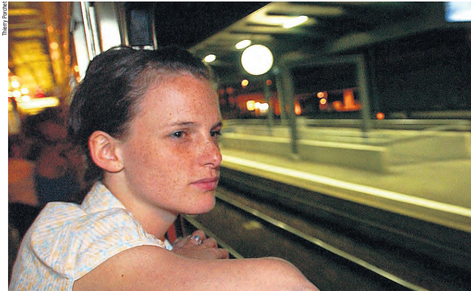
Elvetino und die SBB sollten das Nachtzugangebot verbessern und zum Nachtzugpersonal besser Sorge tragen.

Die Stewards sind wütend auf ihre Arbeitgeberin Elvetino, weil diese die Vereinbarung von 2008 in einem wichtigen Punkt nicht einhält: Ein Steward soll im Prinzip einen Wagen begleiten und zwei nur dann, wenn insgesamt nicht mehr als 72 Reisende zu betreuen sind. Der Zweck der Vereinbarung war, den Fahrgästen einen optimalen Service zu bieten und die Arbeitsplätze des Nachtzugpersonals möglichst beizubehalten. Doch