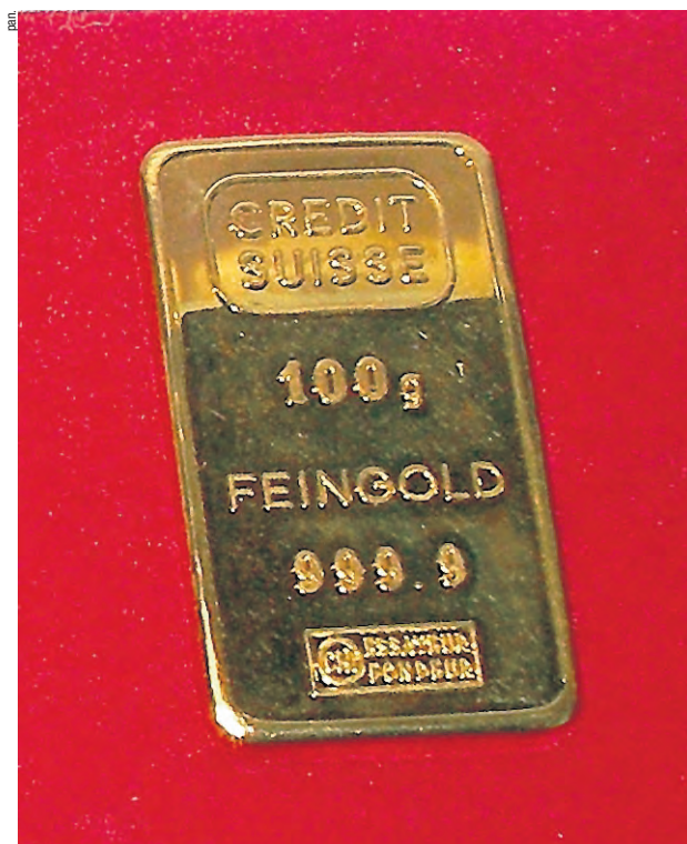
«Am Golde hängt, zum Golde drängt doch alles»: Die PK SBB hat durch die Börsenkrise einen massiven Verlust auf ihren Anlagen eingefahren.