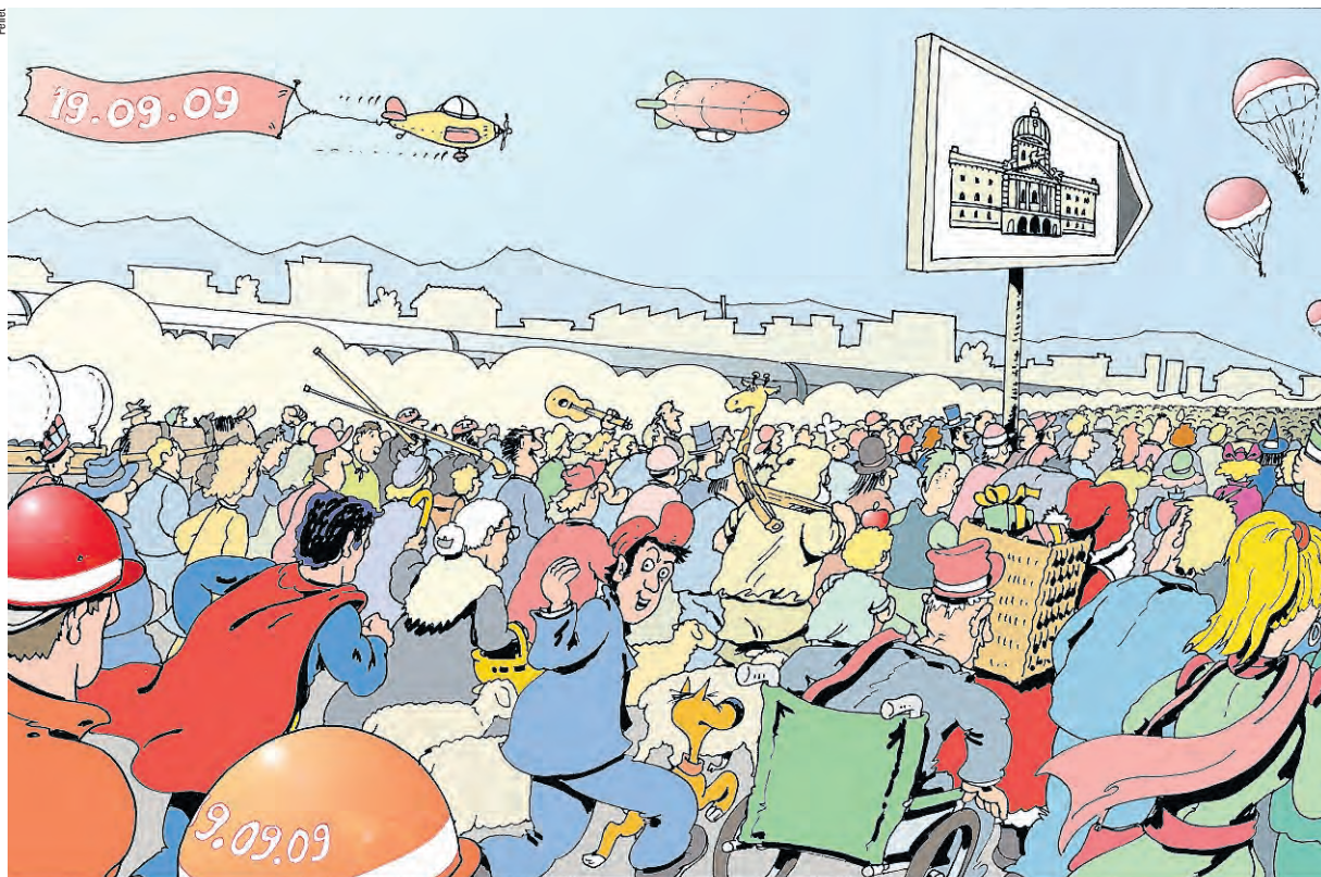
Cartoonist Pellet hat sich bereits in den Kundgebungsumzug Richtung Bundeshaus eingereiht – aber vorher trifft man sich auf der Schützenmatte!