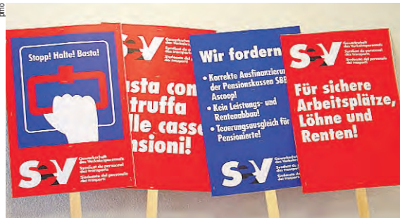
Die Plakate für die Grosskundgebung stehen bereit.

Dossier und Interview zur Pensionskassensanierung ab Seite 10