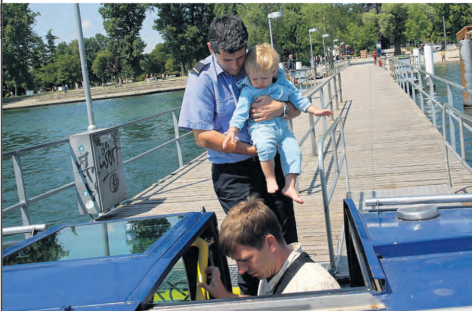
Kundendienst vom Feinsten: Einsteigen mit Limmatbootkassier am Zürichhorn. Im August stellte die Zürichsee-Schiffahrtsgesellschaft ZSG mit 375 941 Fahrgästen einen neuen Monatsrekord auf. Bis Ende August beförderte sie dieses Jahr mit ihren 17 Schiffen auf Zürichsee und Limmat 1,434 Mio. Passagiere – 2,1 % mehr als im Rekordjahr 2008. Die Sommersaison endet am 18. Oktober.