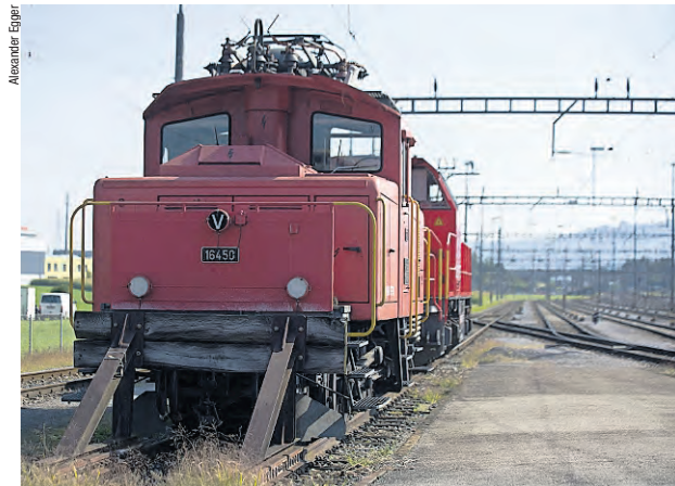
Die Teamloks Ee 3/3 und Am 843 werden Rotkreuz auch bald verlassen.